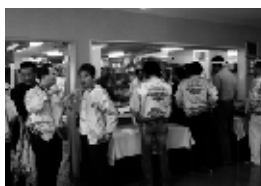
▲食事の準備をするスタッフ達