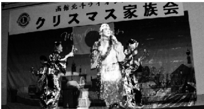
▲ダンサーの息もピッタリ!マツケンサンバ披露

毎年恒例のクリスマス家族例会が今年も開催されました。今年の圧巻は、年末で忙しい中わずかな期間で覚えた「マツケンサンバ」でした。会員の見事な踊りと振る舞いに、会場は一気にヒートアップし、来場されたお客様はライオンズの催しに満足げな表情で大変喜ばれました。今年の例会も無事に終了することが出来ました。