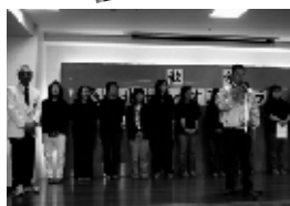
▲L.竹田第1副会長挨拶