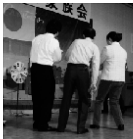
▲射的ゲームに夢中です。