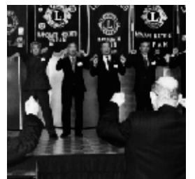
▲今年の思いを込めてロアー