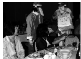
▲サンタ役お疲れさまです。