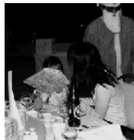
▲サンタからのプレゼントハハ!