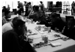
▲食事を楽しむ寮生