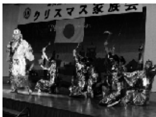
▲見事な踊りパーフェクト!