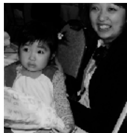
▲サンタを見て何を思ってるのかな