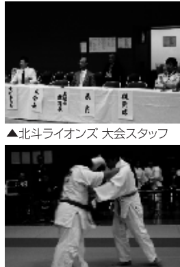
▲北斗ライオンズ 大会スタッフ