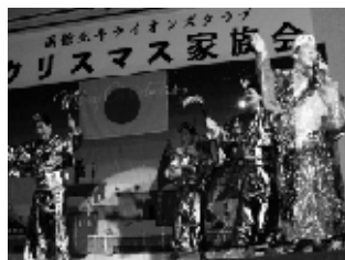
▲マツケン役の斉藤L 光ってました☆