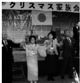
▲ご家族一緒に「また逢う日まで」