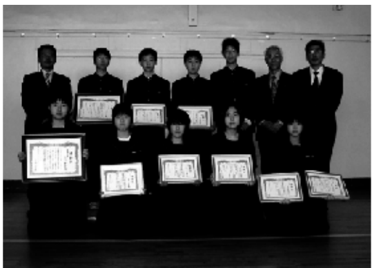
▲受賞者と記念撮影