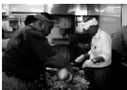
▲焼きそば作りに大忙し!