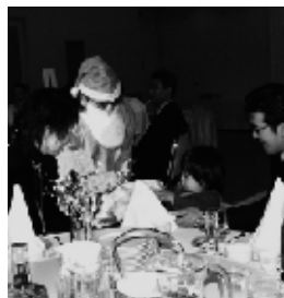
▲喜んでくれたかなハハ!