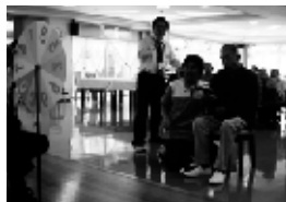
▲射的ゲームに挑戦中の寮生