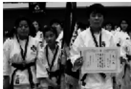
▲少林寺優勝チーム