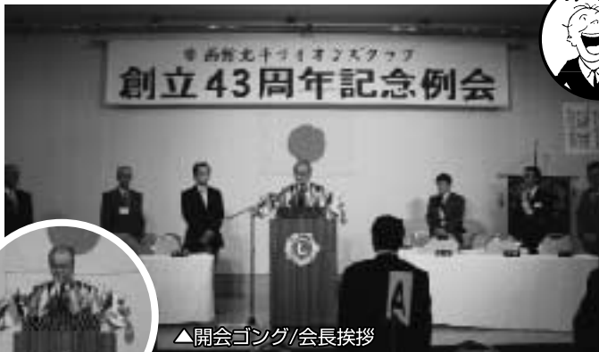
▲開会ゴング/会長挨拶