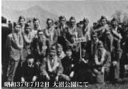
昭和37年7月2日 大沼公園にて