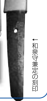
←和泉守兼定の刻印