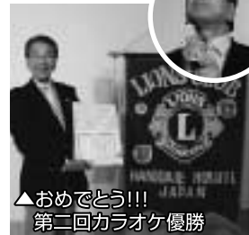
▲おめでとう!!! 第二回カラオケ優勝