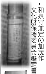
←和泉守兼定の加茂作 文化財保護委員会鑑定書