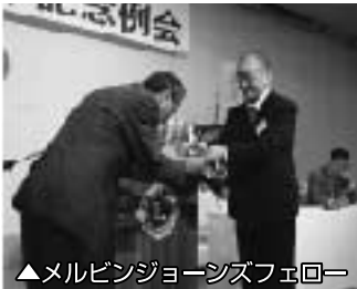
▲メルビンジョーンズフェロー