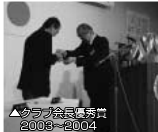
▲クラブ会長優秀賞 2003~2004