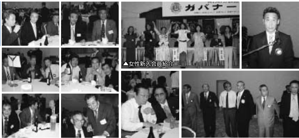
▲女性新入会員紹介